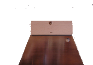
Зубчатый шпатель с шагом 1 мм